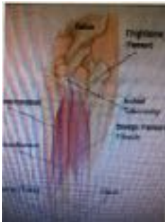
a. Knee Flexion, hip extension งอเข่า ยืดฮิป

29. What is the motion of the highlighted muscle in the image? การเคลื่อนไหวในภาพคือ